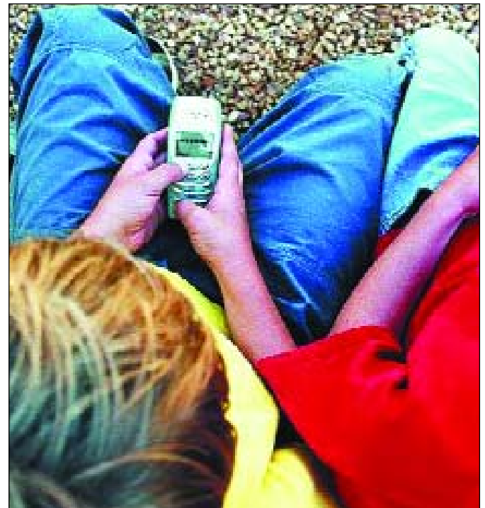
Dos niños escriben mensajes en sus teléfonos móviles.

El alumno debe investigar la respuesta en la web