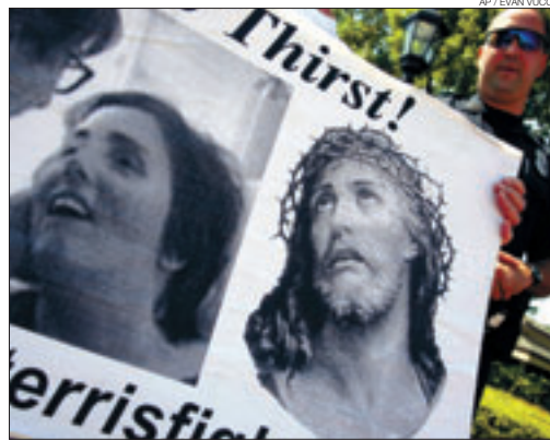
►► Cartel expuesto por los manifestantes frente a la clínica de Schiavo.

nación ha permitido una atrocidad como esta», dijo.